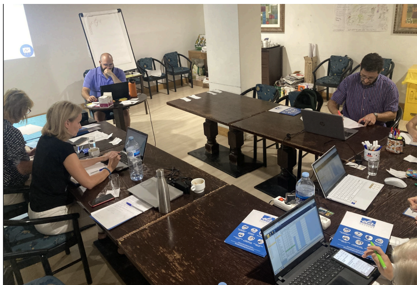
Den 5: ICT ve vzdělávání - sdílení používaných aplikací a seznámení s tvorbou escape game