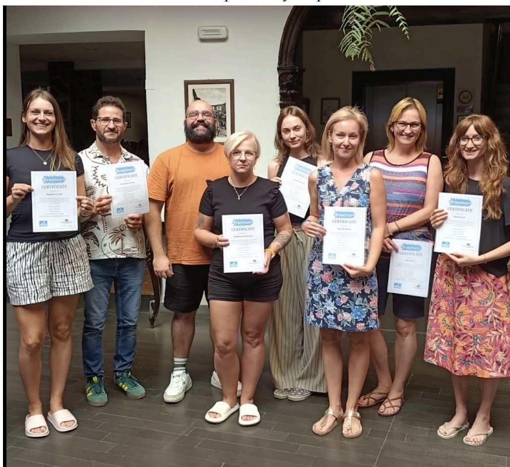
Den 6: Shrnutí kurzu, předání certifikátů a rozloučení